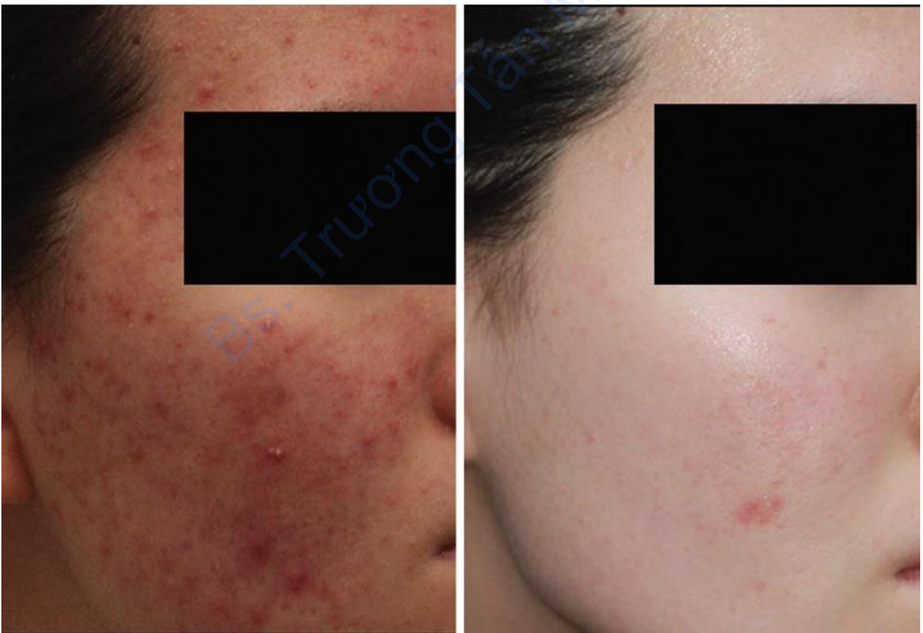
Hình 13.3 Một bệnh nhân nữ 21 tuổi đến khám tại phòng khám của chúng tôi vì mụn trứng cá, rối loạn sắc tố ban đỏ và sẹo teo. Sau khi dùng 10mg isotretinoin uống mỗi ngày trong 3 tháng, cô ấy được thực hiện 3 đợt FMR & NAFL, sau đó là cắt đáy, tiêm chất làm đầy và 2 đợt PDL. Tất cả các tổn thương cho thấy sự cải thiện đáng kể sau 3 tháng

tin rằng các phương pháp điều trị đồng thời cho mức độ trung bình đến nặng của mụn trứng cá và sẹo mụn trứng cá có thể có nhiều lợi ích ( Hình 13.3 ). Trước hết, các phương pháp điều trị chính nhắm vào sẹo mụn, tăng cường sửa chữa lớp bì bằng cách chuyển năng lượng thông qua con đường chi phối TGF- \beta , dường như cũng giúp cải thiện tình trạng mụn viêm. Với thời gian downtime tương đối ngắn hơn so với AFL truyền thống, NAFL đơn độc thậm chí được sử dụng trong điều trị mụn trứng cá hoạt động [100]. Nhóm chúng tôi cũng xác nhận rằng FMR có hiệu quả trong việc cải thiện mụn trứng cá [101]. Kim được đưa thích hợp vào xung quanh các tuyến bã nhờn có thể tạo ra nhiệt chủ yếu xung quanh các tổn thương mụn trứng cá vì lipid bã nhờn có khả năng kháng điện với các mạch tích hợp RF, dẫn đến tổn thương cấu trúc và chức năng tuyến bã. Bản thân microneedle cũng gây ra sự tiết các yếu tố tăng trưởng và sự di chuyển của các tế bào lân cận, không chỉ dẫn đến sự hình thành chất nền ngoại bào mà còn ảnh hưởng đến các tuyến bã nhờn. Trên thực tế, điện phân tuyến bã nhờn có chọn lọc bằng kim cách điện siêu nhỏ được sử dụng với mụn trứng cá hoạt động [102, 103]. Khi bệnh nhân quan tâm nhiều đến chứng tăng tiết bã nhờn, kết hợp laser diode 1450nm với phác đồ điều trị sẹo cũng có hiệu quả [104, 105].