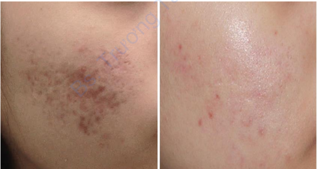
Hình 13.2 Một bệnh nhân nữ 27 tuổi đến khám tại phòng khám của chúng tôi vì sẹo mụn teo quanh má. Sau bốn buổi FMR & NAFL, tiếp theo là CROSS, cắt đáy, tiêm chất làm đầy và tiêm axit hyaluronic bằng khí nén không dùng kim với khoảng thời gian cách nhau một tháng, đã có sự cải thiện đáng kể sau 4 tháng